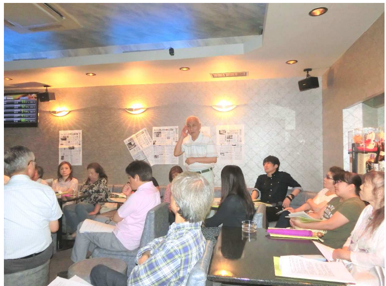
過去の取り締まりの経験を語る