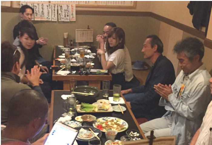
懇親会では頼りになるOBに商売のアドバイスを頂きました

大和民商青年部は6月23日、大和民商事務所にて平成30年度定期総会&懇親会を開催、県下民商からの来賓も含め、11名が参加しました。 一年の間ではありますが、青年部長が不在だった為に部会や総会が開けない時期が続いてきましたが、神青協の働きかけもあり、今総会にて新青年部長&副部長が誕生しました。 新部長就任を機に今後は活発な青年部活動をカンフル剤とし、大和民商 会員500名の目標を達成していきたいと思えます。