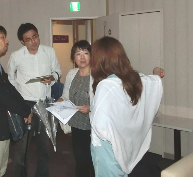
事前のスナック訪問行動

見直す必要がある」と断言していました。 また対策として警察の不当な立ち入り には録音などの証拠を残すこと、冷静に 対応し必要以上のことは話さない、署名・ 押印などはしない等のアドバイスもあり ました。