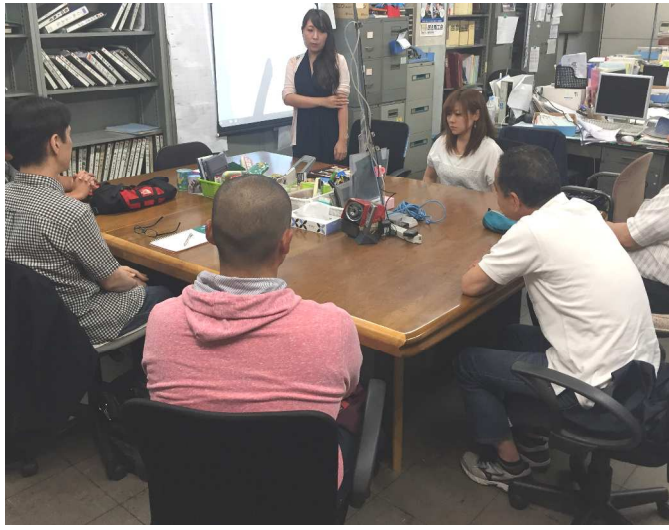
新たに部長、副部長が誕生した青年部総会

大和民商青年部は6月23日、大和民商事務所にて平成30年度定期総会&懇親会を開催、県下民商からの来賓も含め、11名が参加しました。 一年の間ではありますが、青年部長が不在だった為に部会や総会が開けない時期が続いてきましたが、神青協の働きかけもあり、今総会にて新青年部長&副部長が誕生しました。 新部長就任を機に今後は活発な青年部活動をカンフル剤とし、大和民商 会員500名の目標を達成していきたいと思えます。