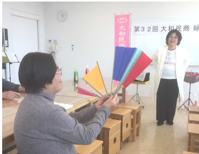
大盛り上がりのマジックショー

3月24日シリウスにて、第32回婦人部定期総会が20名の参加のもと開催されました。昨年に引き続き、56条請願など活動方針が確認・採択されました。 総会後のお楽しみ企画として、昨年は「お琴と尺八の演奏会」を開催しましたが、今年も豪華弁当を頂いた後、オカリナの演奏による童謡を合唱、会員さんによるマジックショーを開催。特にマジックショーでは会場が大いに盛り上がりました。 今年は、先日、婦人部員の方に送付させて頂いた総会決定書の活動方針を基に、より「層活発な婦人部活動を行っていききたい」と思います。