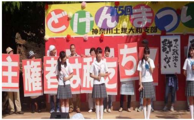
制服向上委員会のステージ